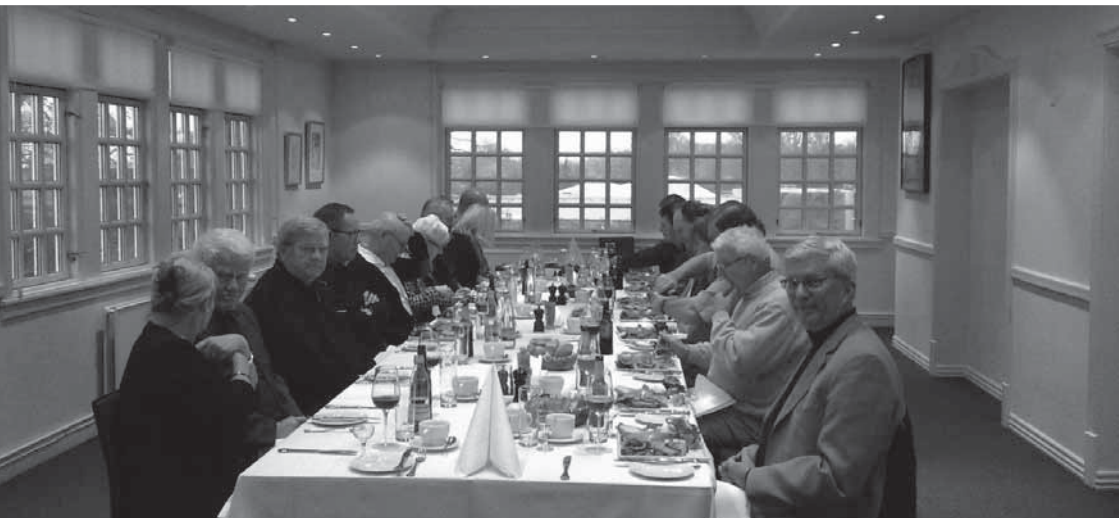
Den hyggelige frokost på Café K i Zoologisk Have.