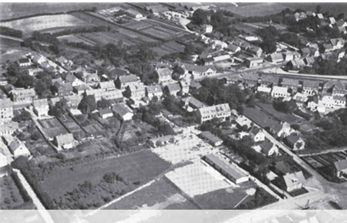
Skolen set fra luften ca. 1957, foto fra TMR julekort.

Noget af det første, der skal ske, er, at jeg skal udstyres med en skoleuniform og tilhørende kasket. Som læsere af KONTAKTEN ved, er uniformen et sort jakkesæt, og med