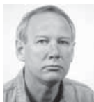
Af Troels Hallig, R67

GRAVMØDET FANDT I ÅR STED SØNDAG DEN 24. NOVEMBER KL. 12.00, HVOR VI MØDTE VED KAPELLET PÅ SOLBJERG PARKKIRKEGÅRD FOR HEREFTER AT LÆGGE ET PAR KRANSE VED FRK. HØYER OG FRK. HESSEDAHLS GRAV.