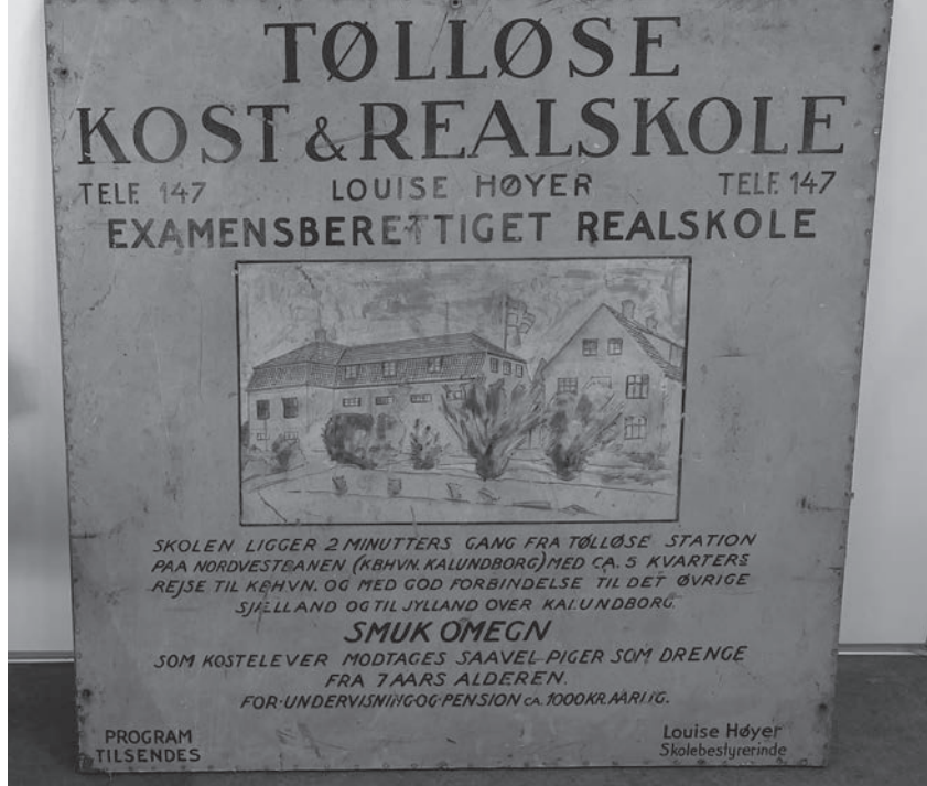
Skiltet, skolen forærede elevforeningen.