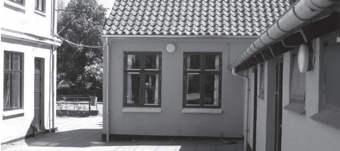
Bygningen der tidligere husede regnskabsfunktionen og blev bestyret af kontorchef Jessen.

kateteret over mod bordene for at redde glasset med farveladevandet, så det ikke røg på gulvet. I samme sekund trak vi de 4 borde helt fra hinanden, og jeg kan huske, hvordan glasset faldt gennem hr. Langs hånd ned på gulvet, da han prøvede at gribe det samtidig med, at vi råbte "O'le".