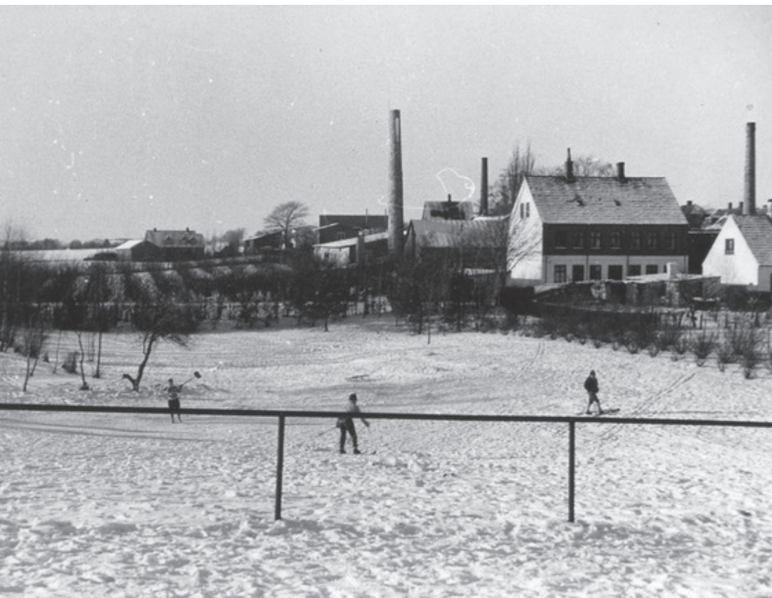
Udsigt over den snebelagte dal

Det var farligt. Jernrøret kunne straffe én hårdt. Hvis man ikke kunne holde balancen, faldt og fik jernrøret mellem benene, drejede rundt, og landede hårdt på jorden. AV.