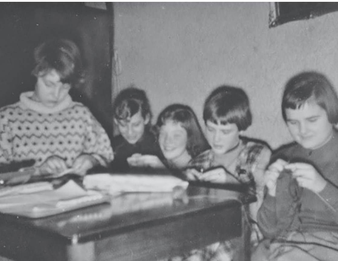
Der hygges på værelset.