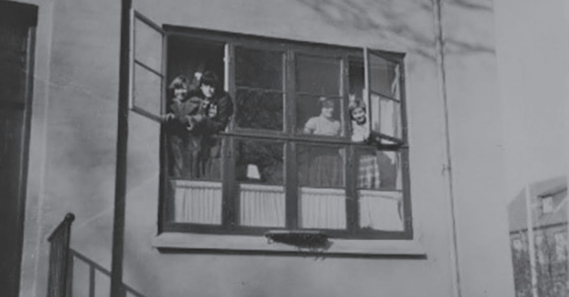
De store pigers værelse ved siden af hoveddøren.