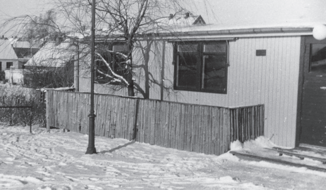
Snefoto af Alléhuset – den del af Alléhuset, der vender mod dalen