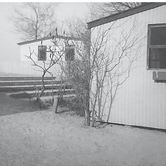
Udsnit af de små grønlandshuse.

Om aftenen skulle de "gamle" kostelever så ankomme. Det var vi meget spændte på, da de jo havde en masse erfaring fra skolen osv. Jeg mener, vi skulle ligge i vores senge, når de ankom med toget ved 21-tiden.