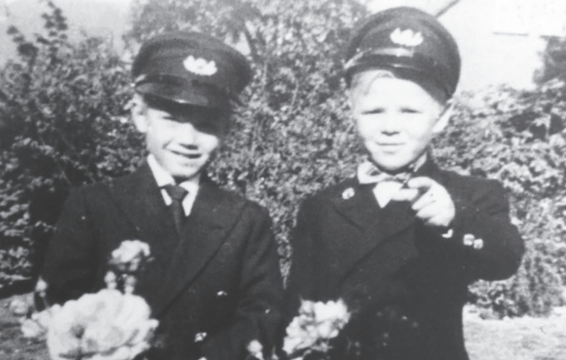
To små kostelever i den uniform, som de kun bar ved ud- og hjemrejse til skolen samt ved festlige lejligheder. Den daglige påklædning var af gråt stof og plusfours. Udateret foto.