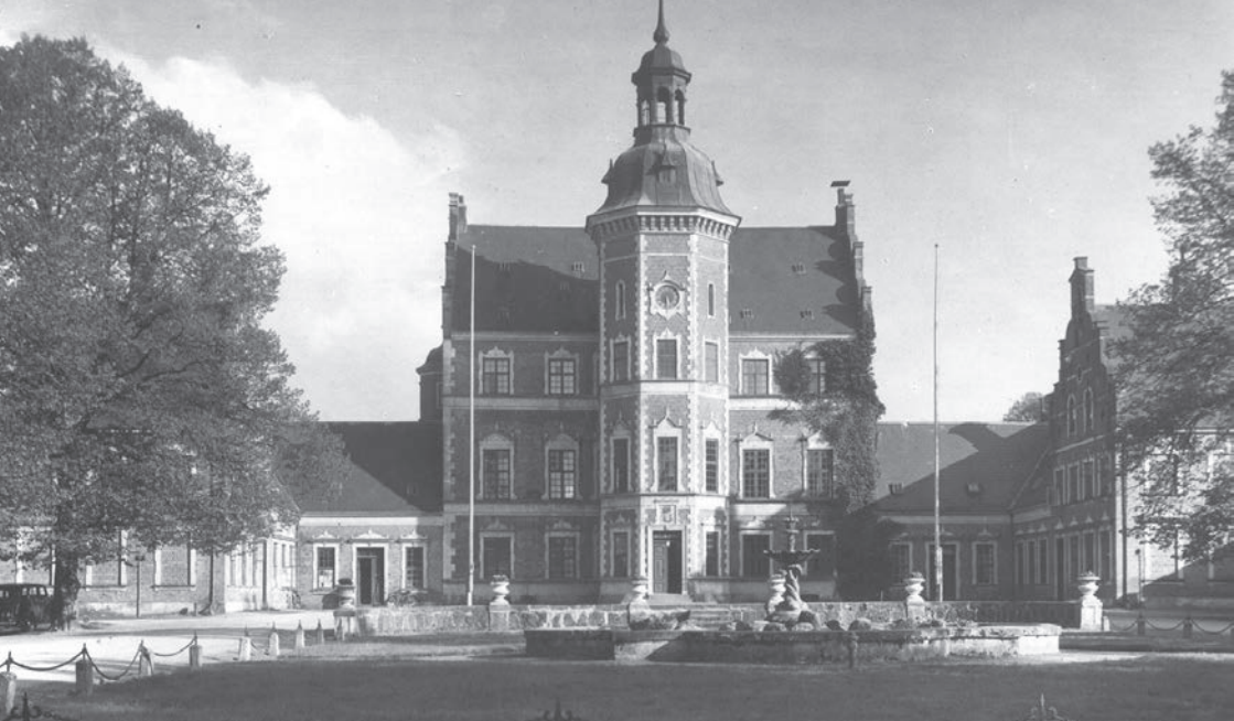
Tølløse Slot – som det så ud i 1939.