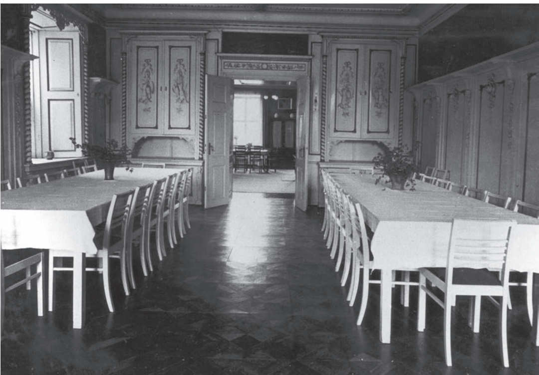
Tølløse Slot spisestuen.