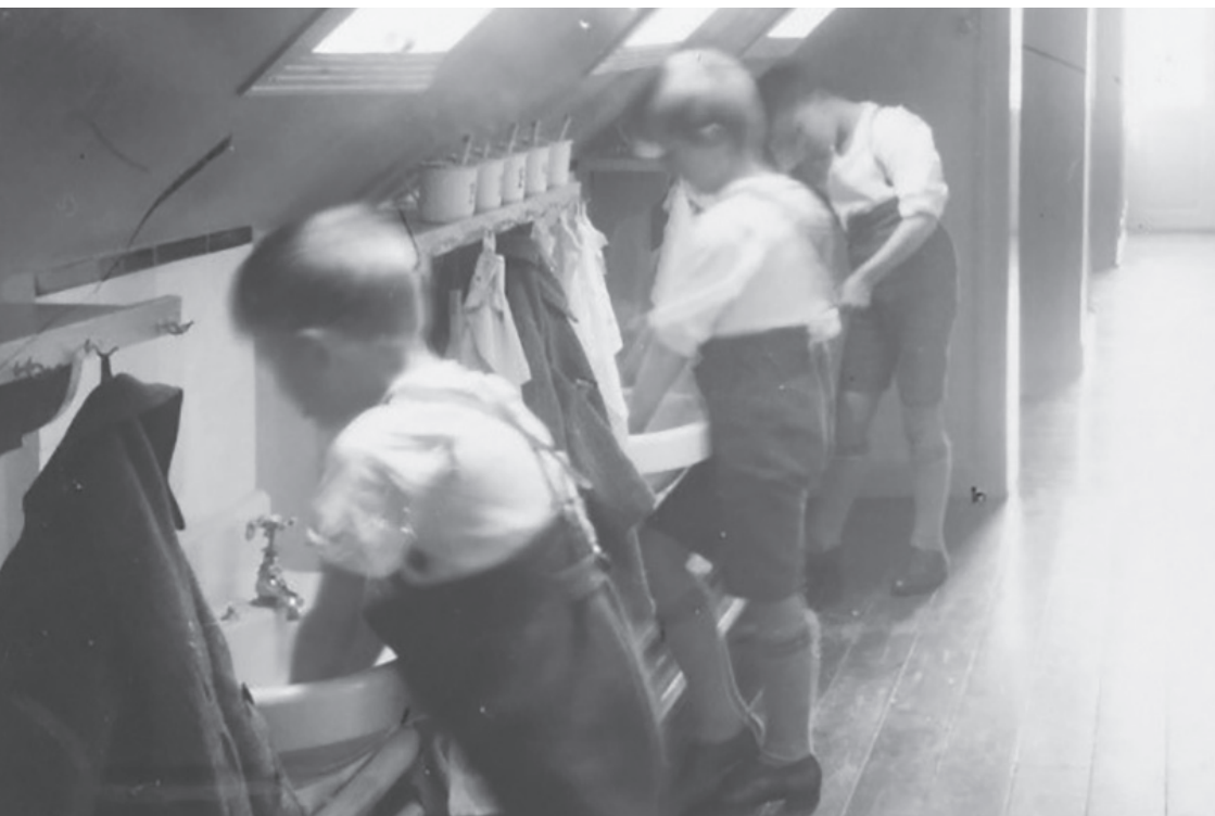
Nogle af de små kostelever ved vaskekummerne på gangen. Udateret.