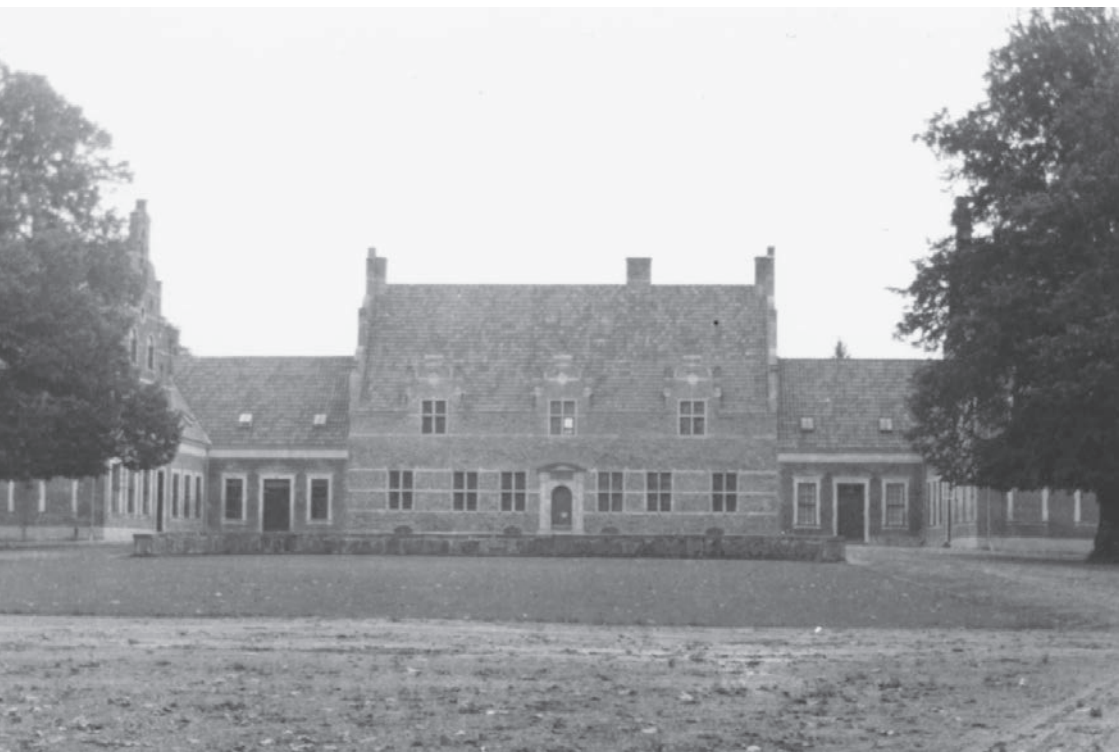
Tølløse Slot – den nye hovedbygning efter branden.