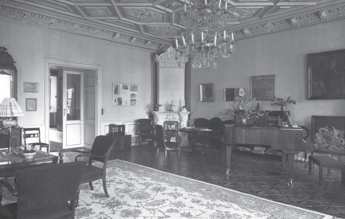
Tølløse Slot havestuen.