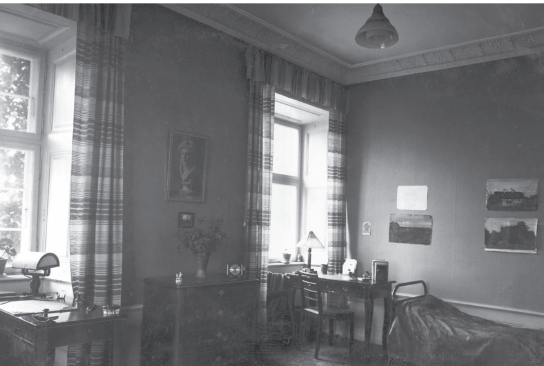
Tølløse Slot, kostelevværelse.