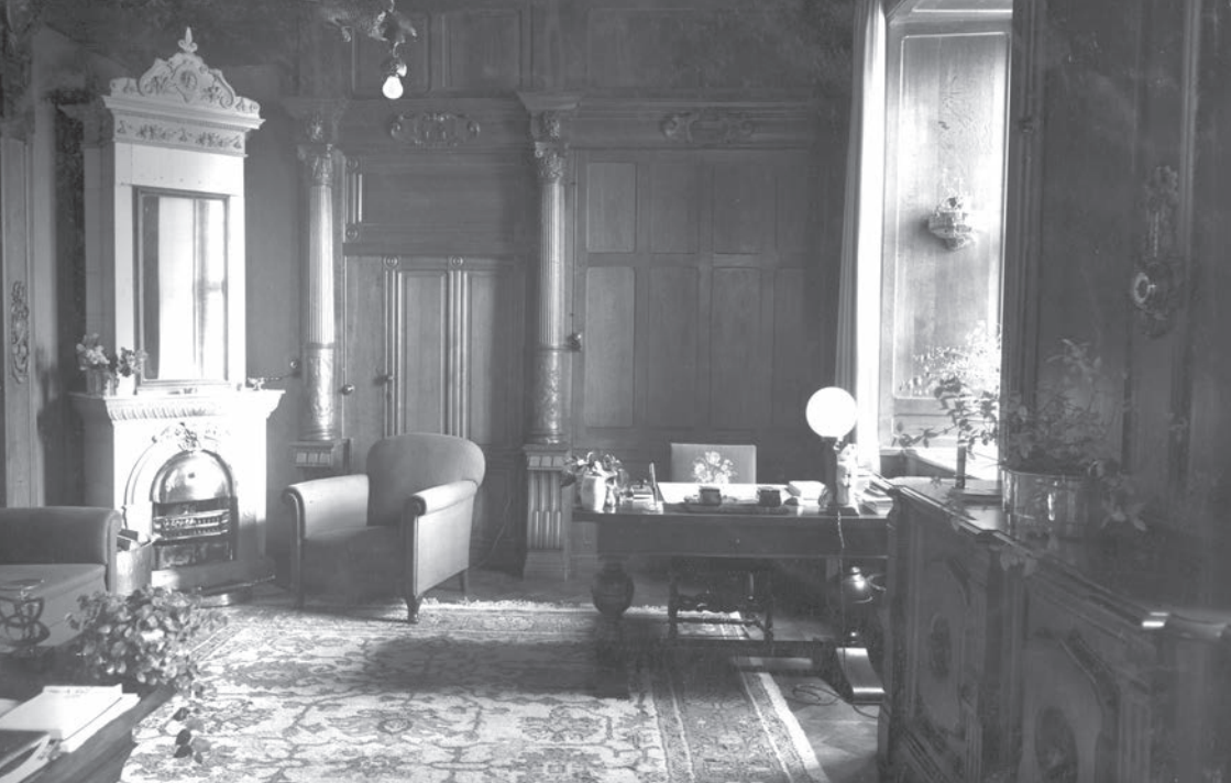
Tølløse Slot jagstuen.